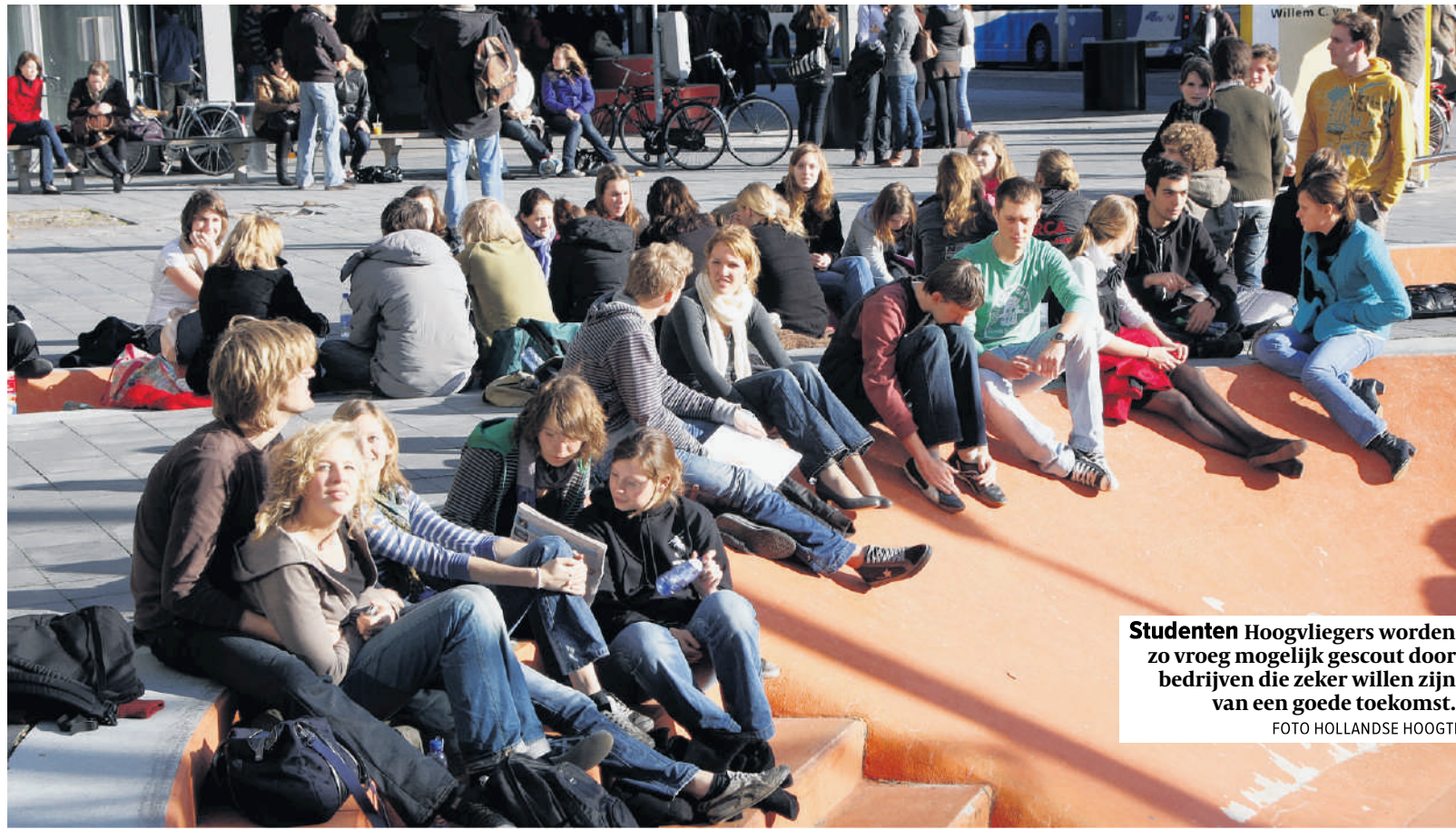
Studenten Hoogvliegders worden zo vroeg mogelijk gescout door bedrijven die zeker willen zijn van een goede toekomst.

Zoveel ioneren zijn door het CWI aan werk of een staae geholpen.