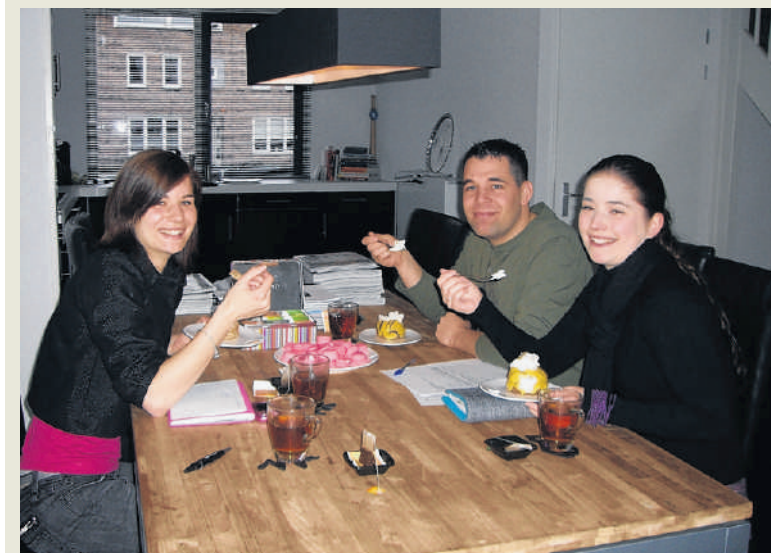
Bridestaart De mooiste dag uit iemands leven vraagt om een goede organisatie. 'Weddingplanner zijn betekent ook bruidstaarten uitproberen, heerlijk!'