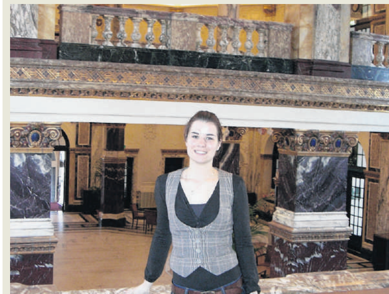
Droomlocatie 'Ik ben altijd op zoek naar perfecte trouwlocaties. Zoals hier in Het Tropenmuseum in Amsterdam.'